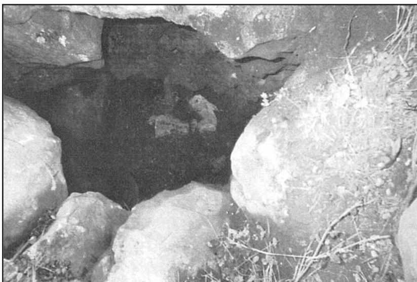
Είσοδος της σπηλιάς του Αθανασάκη στο Βουνό Προφ. Ηλίας του Μαρτίνου.