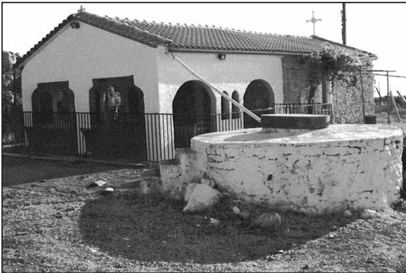
Το εκκλησιάκι του Προφήτη Ηλία στην κορυφή του βουνού 636μ. μέχρι εκεί φθάνει αμαξιτός δρόμος, απομένουν 1000μ. Ν. Δυτικής πορείας (μονοπάτι) για να φθάσεις στην σπηλιά.