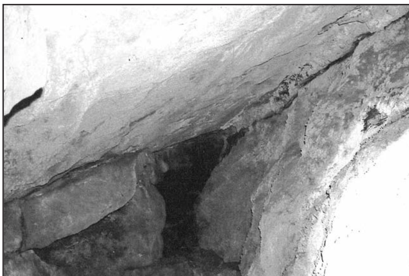
Στένωμα (πόρτα) στο εσωτερικό της σπηλιάς που πρέπει να περάσεις για να πας στον κοιτώνα του Αθανασάκη.