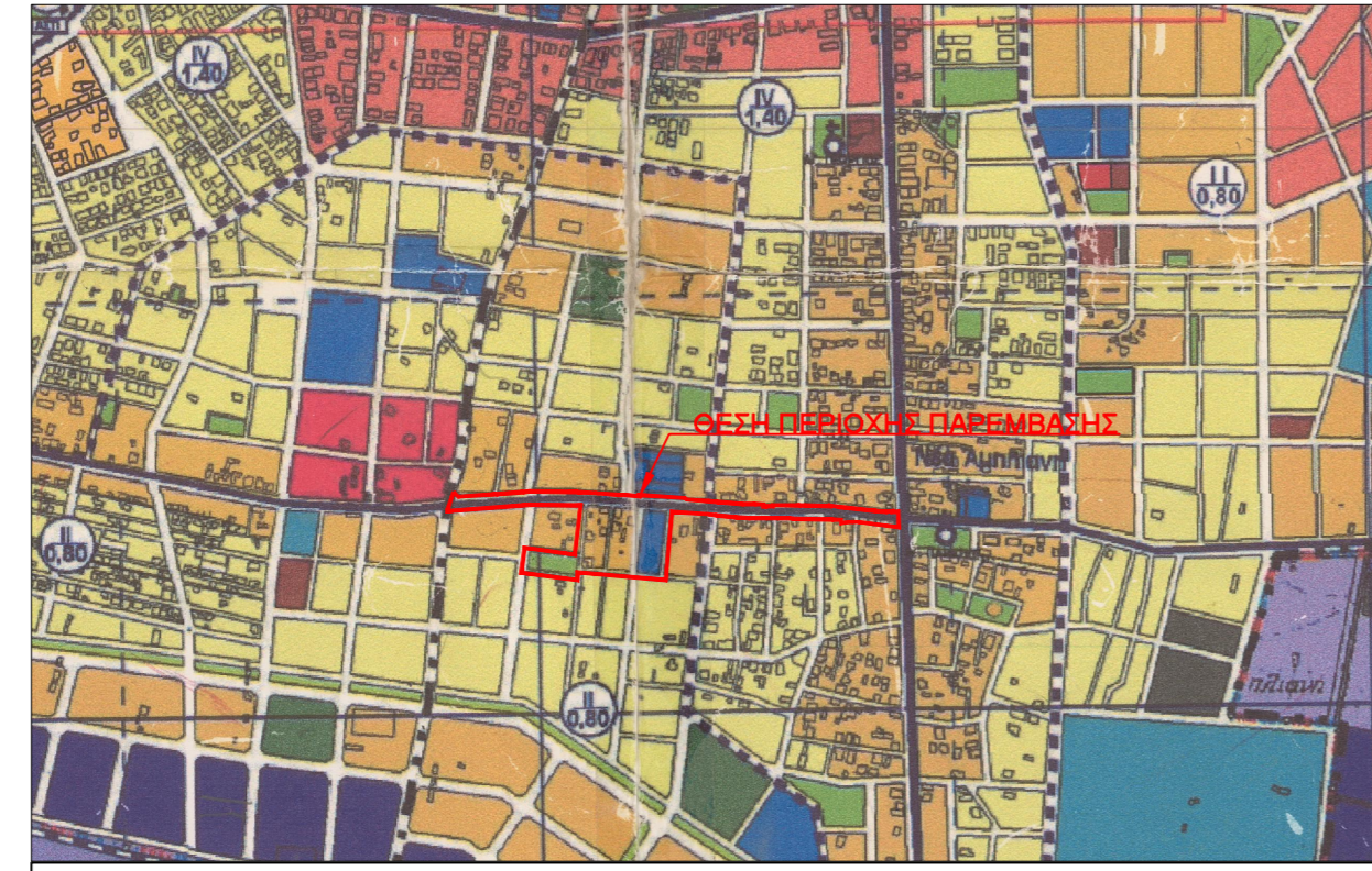
ΑΠΟΣΠΑΜΑ Γ.Π.Σ. ΠΟΛΕΩΣ ΛΑΜΙΑΣ - ΚΛΙΜΑΚΑΣ 1:10000