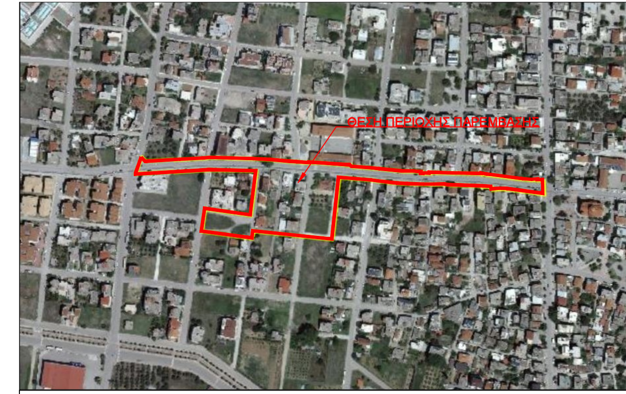
ΑΠΟΣΠΑΜΑ ΧΑΡΤΗ ΚΤΗΜΑΤΟΛΟΓΙΟΥ - ΚΛΙΜΑΚΑΣ 1:5000