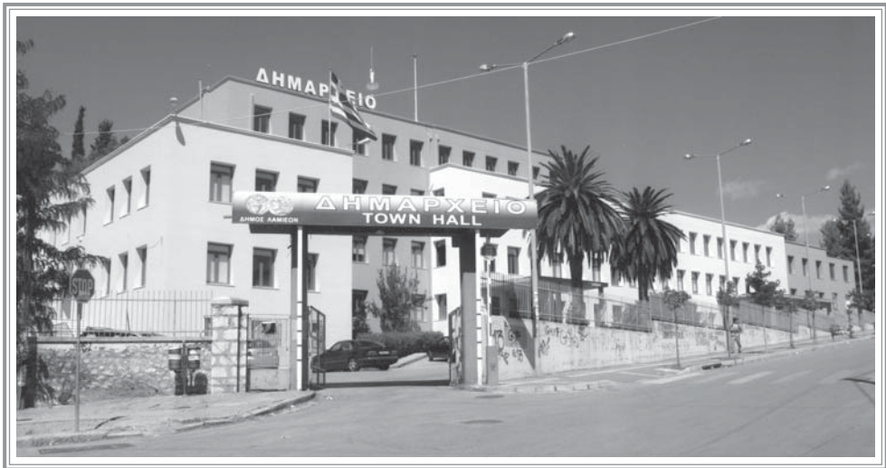
ΤΟ ΣΗΜΕΡΙΝΟ ΔΗΜΑΡΧΕΙΟ ΤΗΣ ΠΟΛΗΣ