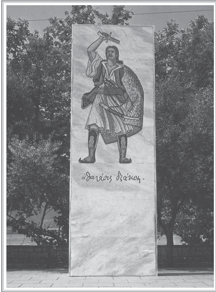
Βοΐλα: «ΑΘΑΝΑΣΙΟΣ ΔΙΑΚΟΣ» ΣΤΗΝ ΑΛΑΜΑΝΑ