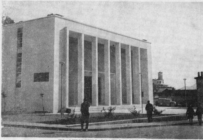
ΤΟ ΔΗΜΟΤΙΚΟ ΘΕΑΤΡΟ ΛΑΜΙΑΣ

('Επί Δημαρχίας 'Ιωάννου Παπασιπούλου ἐν ἔτει 1961)