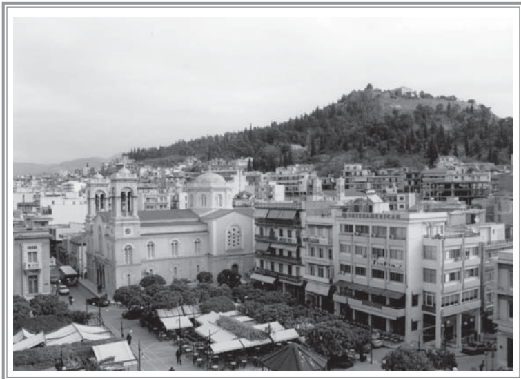
ΛΑΜΙΑ: ΠΛΑΤΕΙΑ «ΕΛΕΥΘΕΡΙΑΣ»